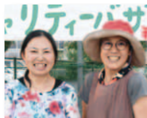
8/18 GENKI×10 #チャリティーまつり