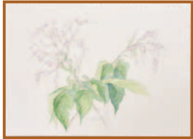
『くさぎの花』水彩画