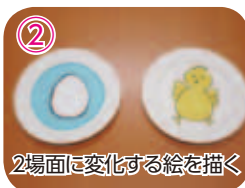
② 2両面に変化する絵を描く