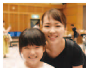
8/8 片山科学子ども教室