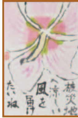
『猛暑に負けない木槿』 絵手紙 むくげ