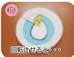
⑤ 回転させると・・・