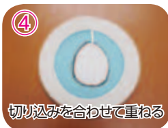
④ 切り込みを合わせて重ねる