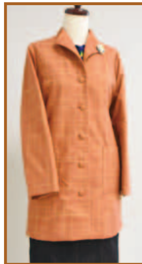
『チュニック(着物のリフォーム)』 洋裁