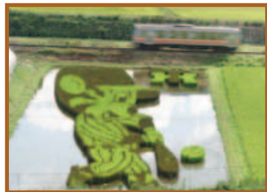
『田んぼアート』写真