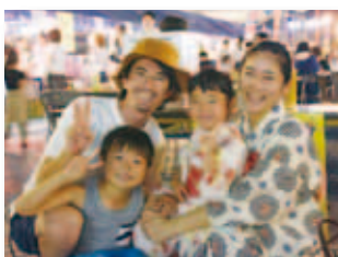
8/25 チャリティーイベント 『がんばろう!!井原!』