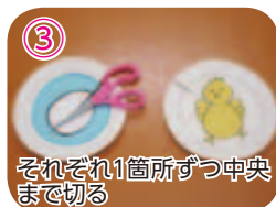
③ それぞれ1箇所ずつ中央まで切る