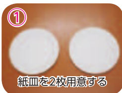
① 紙皿を2枚用意する