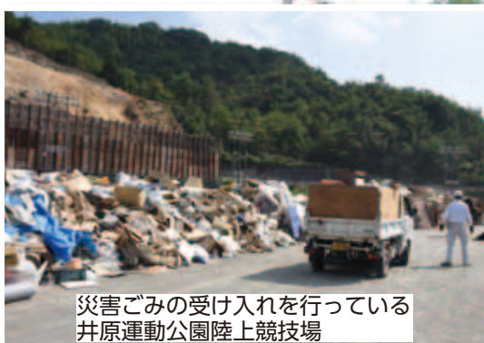
災害ごみの受け入れを行っている 井原運動公園陸上競技場