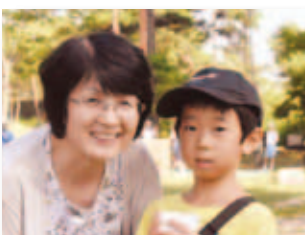
8/4 美星っ子 夢フェスティバル