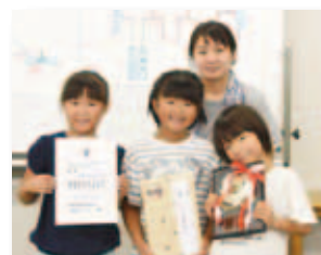
7/21 「ふるさとかるた」 発刊記念かるた大会