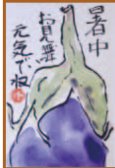
『我家の水なす』絵手紙