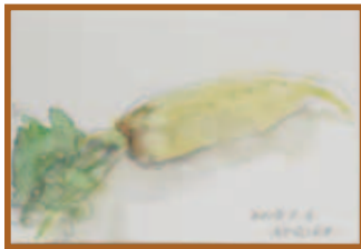
『だいこん』はがき絵