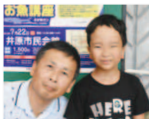
7/22 さかなクンのギョギョツ とびっくりにお魚講座