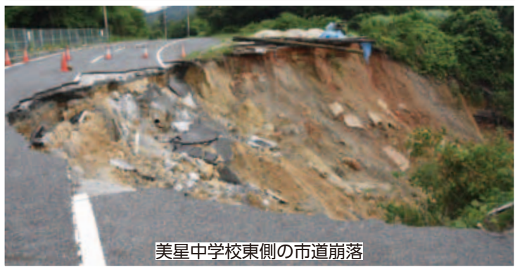
美星中学校東側の市道崩落