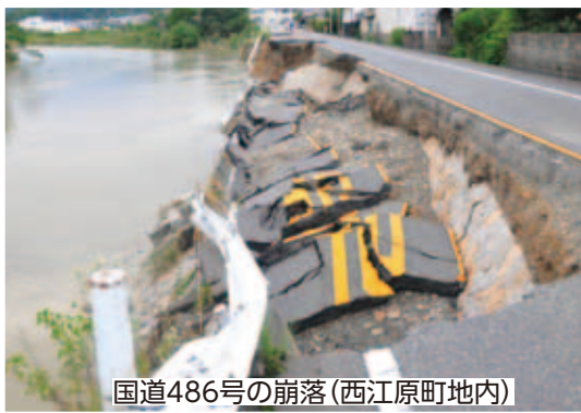
国道486号の崩落(西江原町地内)