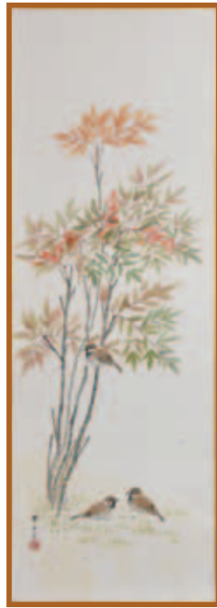
『南天に雀』水墨・淡彩画