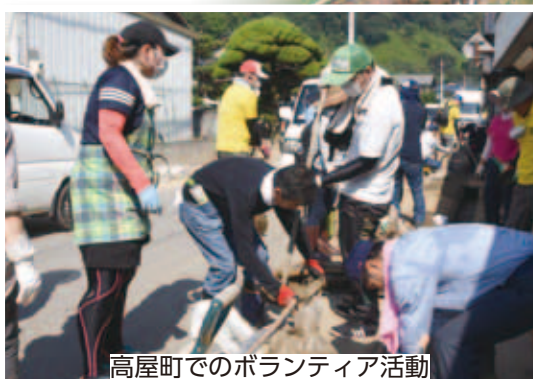
高屋町でのボランティア活動