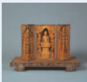
▲平櫛田中<<降魔>> 小平市平櫛田中彫刻美術館