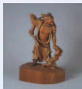
▲平櫛田中<<鍾馗>> 小平市平櫛田中彫刻美術館