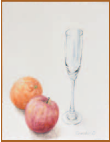
『グラスと果物』 水彩画