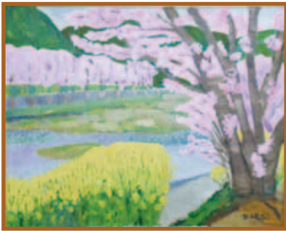
『井原堤』 油絵 (30号)