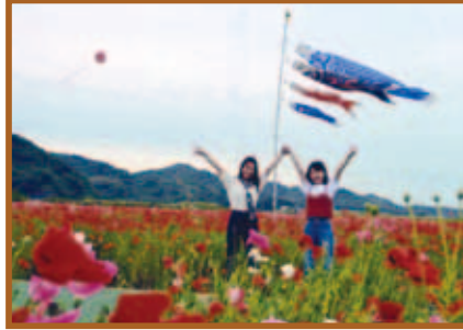
『ベイファームのポピー』 写真