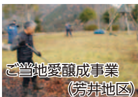
ご当地愛醸成事業 (芳井地区)

地域の学び事業(継続)、子育て支援事業(新規・人口増)、防災対策事業(新規)、ご当地愛醸成事業(継続・一部人口増)、移住定住対策事業(継続・一部新規・人口増)