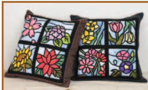
『クッション』 パッチワーク