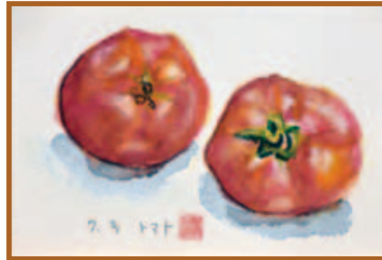
『夏野菜「トマト」』 はがき絵