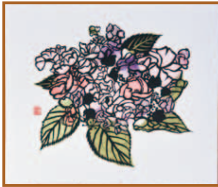
『変わり紫陽花』 きりえ