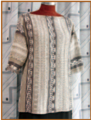
『ストレートネックの プルオーバー』 編物