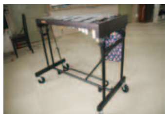
▲【教育】小・中学校への楽器の購入