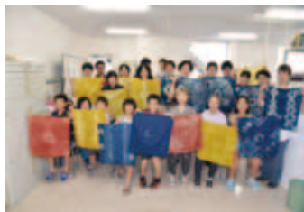
▲【文化】文化財センター講座(染めもの体験)