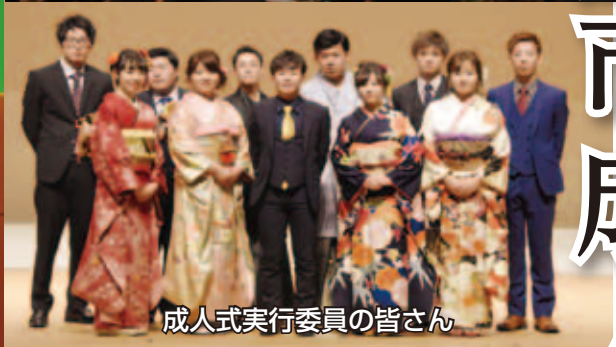
成人式実行委員の皆さん