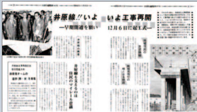
◀ 昭和62年11月号 工事再開

昭和26年に国鉄吉備線を福山市まで延長する構想が明らかにされてから、長い年月を経て開業し、20周年を迎えた井原線。今後も沿線住民やこの地を訪れる人々の「マイレール」としての役割を担うことが期待される井原線を市広報誌とともにその歴史を振り返ります。