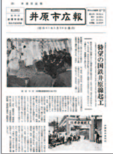
▲ 昭和41年5月30日号 国鉄井原線起工