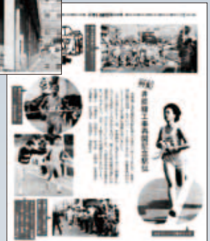
▲ 昭和63年2月号 工事再開記念駅伝