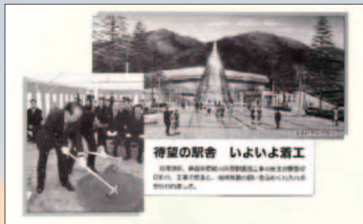
▲ 平成9年11月号 井原駅建設工事くわ入れ式