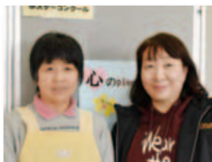
1/19 人権が尊重される まちづくりの集い