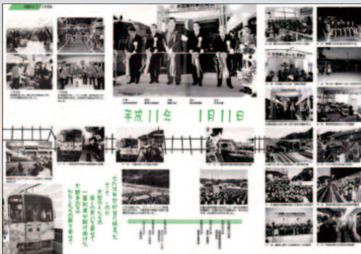
▲ 平成11年2月号 井原線開業に沸く各駅