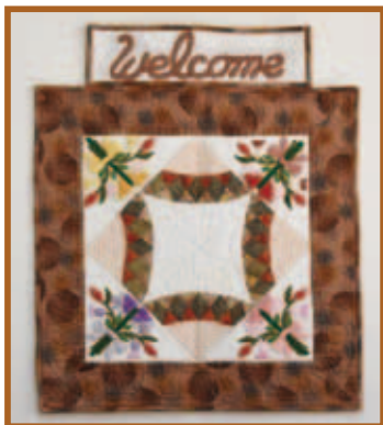
『シクラメンのタペストリー』 パッチワーク