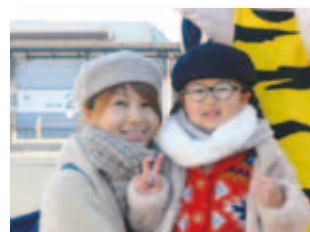
1/13 井原線開業20周年 記念イベント