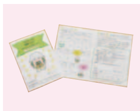
ポイントがたまったら…