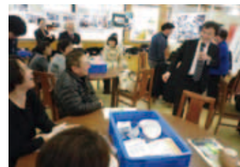
▲【環境】環境マイスター養成講座