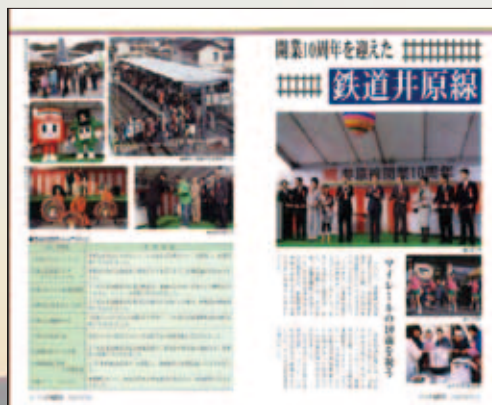
◀ 平成21年2月号 開業10周年イベント