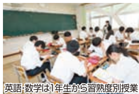
英語・数学は1年生から習熟度別授業