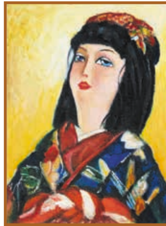
『高梁の雛』 油絵 (F4号)