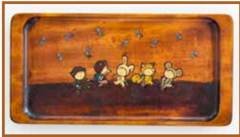
『みんな楽しく』 木彫