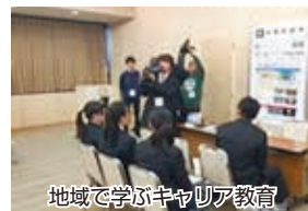
地域で学ぶキャリア教育

普通科では、習熟度別授業や個別指導を通して、着実に学力を高めることができます。放課後は「学習サロンいろは」、土曜日や休日の「学習会」で苦手克服にも挑戦できます。また、企業調べや大学訪問なども充実していて、幅広い進路が選択できます。井原高校で、あなたの将来の夢をつかみましょう。