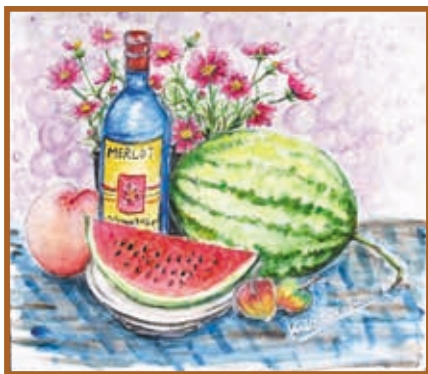
『夏から秋へ』 水彩画