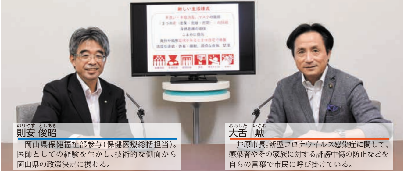
のりやす としあき 則安 俊昭

岡山県保健福祉部参与(保健医療総括担当)。医師としての経験を生かし、技術的な側面から岡山県の政策決定に携わる。