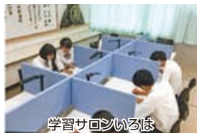
学習サロンいろは