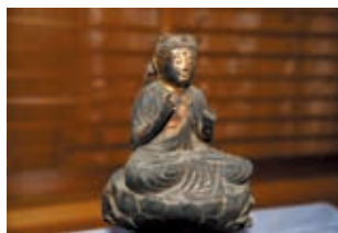
▲菩薩形坐像 成福寺(芳井町)蔵