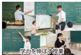
学力を伸ばす授業

◆難関国立大学から就職に至るまで多様な進路目標への対応を可能にする3つの類型を普通科内に設置し、これまで以上に丁寧できめ細かい進路指導を行います。