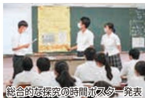
総合的な探究の時間ポスター発表