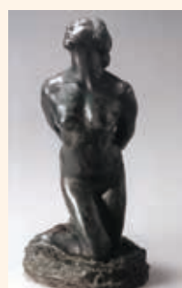
▲荻原守衛<女> 明治43年作 公益財団法人 崂山美術館蔵

●特別展へご招待 定員 30組(先着順) ※1組2人までです。 申込締切 9月9日(水)必着 申込方法 往復はがきに、“荻原守衛展 招待希望”と書き、返信はがき に郵便番号、住所、氏名を記入 の上、郵送で申し込み 通知方法 返信はがきを送付 ※はがき持参の人は、会期中2人まで ご入館いただけます。