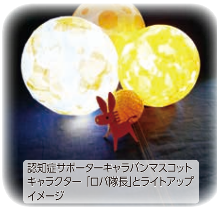
認知症サポーターキャラバンマスコットキャラクター「ロバ隊長」とライトアップイメージ

※そのほか、関係機関の協力を得て、認知症支援者の輪を広げる取り組みを実施します。