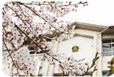
校内の桜も綺麗に開花しました

臨時休校の延長には、「早く学校に行きたい!」という生徒の声も聞こえてきました。「学校のことが好き!」とってくれる生徒が多くいることが励みです。いろいろと制限されることも多く、静かなスタートとなりましたが、全員で協力して乗り越えていきたいと考えています。