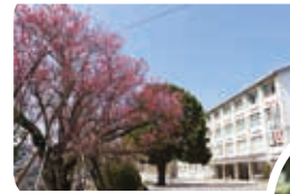
3月中旬に満開になった紅梅