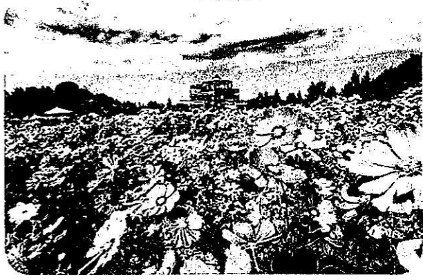
コスモスがきれいでした (北房コスモス公園にて)