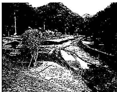
左の写真は 中村川砂防公園

柳井:現在13台分の駐車場が合計73台分の駐車場となり多くの観光客に喜ばれると思います。また、ホテル観賞用のベンチ設置もあり、井原市のホテル観賞の名所としてのPRもしていただきたいと念願し質問を終わります。