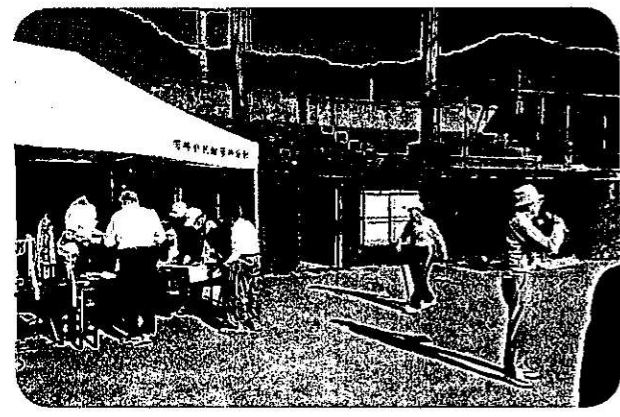
芳井老人連合会主催のグランドゴルフ大会 皆さん、はつらつとプレーされていました