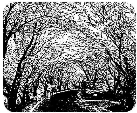
与井土手のさくらトンネル

2月定例議会は平成30年2月26日から3月22日までの25日間で平成30年度の予算を含め37議案の審議はすべて可決承認されました。一般質問では天神峡周辺の環境整備について問いました。