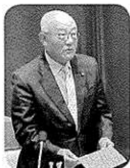
一般質問の様子・登壇中の本会議場風景