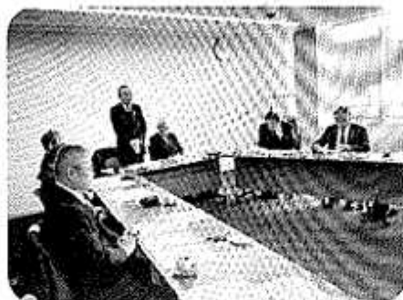
長門市議会改革視察