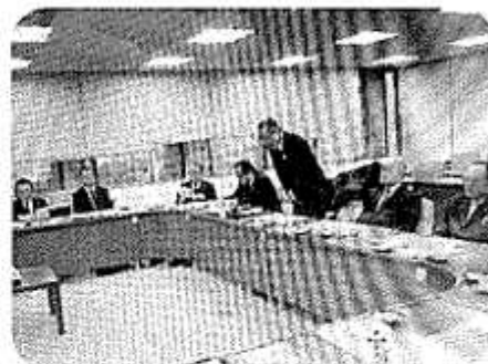
中津市議会改革視察