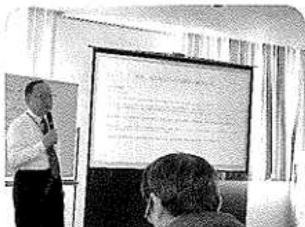
博多で議会改革の研修会

Q & Aチラシについては、すでに窓口を用意しているが、今後自治会の回覧などでもお知らせしたいと考えている。また、出前講座についてはご提案のとおり、来年度の出前講座のメニューに加えたいと検討している。