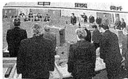
導入継中...を基は会し 本会議での採決(中国新聞より)