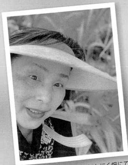
大江 にんにく畑にて