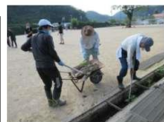
芳井小学校・幼稚園整備作業 地域の方々も交えて汗を流す

八月二十日(日)七時三十分から、芳井小学校で整備作業が完了しました。今回は、学校運営協議会からの呼びかけに賛同くださった地域の方々も交えて先生・保護者の方々と共に、現場整備に汗を流しました。ご協力いただいた皆様ありがとうございました。九月十八日(木)十四時三十分からは、芳井中学校で、奉仕活動が行われます。また、たぐさんの皆様にご協力いただければ幸いです。よろしくお祈りします。