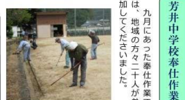
芳井中学校奉仕作業 は、九月にあつた奉仕作業で、地域の方々二十一人が参加してくれました。

これまで担任の先生のみで行っていた朝学習に、十月から地域の方々も加わり、先生方も協力して指導にあたり、先生方も協力して指導にあたり、地域の方々に採点してもらったり、九九の合格をもらったりして、喜ばれ、子ども達も意欲的にがんばっています。