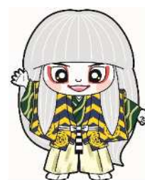
井原市マスコットキャラクター でんちゅうくん