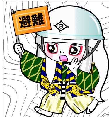
井原市マスコットキャラクター でんちゅうくん